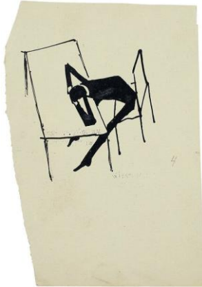
Illustration von F. Kafka, ca. 1901-07