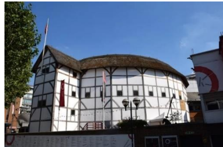
Pic. 2: The Globe Theatre Reboot: Bringing Drama Full Circle

Have you ever wondered why William Shakespeare is still the most celebrated writer of all time? Step into the dynamic world of the 16th century and discover why Shakespeare's plays continue to captivate audiences around the globe, almost 500 years after his birth. From political intrigue to timeless romance, from epic battles to heart-wrenching tragedies, Shakespeare's works are a treasure trove of human experience, emotion, and wisdom. His 38 plays and 154 sonnets have inspired artists, actors, and creators for centuries — and now it is your turn!