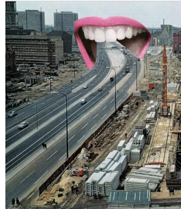
Collage 101 von Marisa Ba- zan, Jahr unbekannt

Sie interessieren sich für Geschichten, die nicht nur mit Worten, sondern auch mit Bildern erzählt werden?